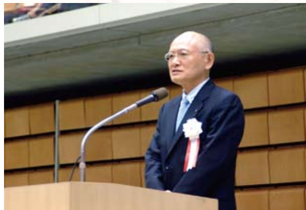
歓迎のこたば 高澤基石川県バドミントン協会会長