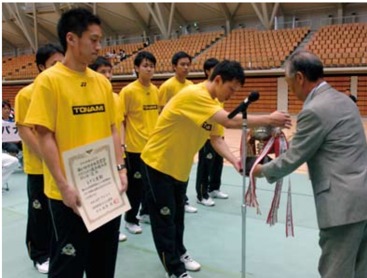
男子優勝 トナミ運輸(富山県)