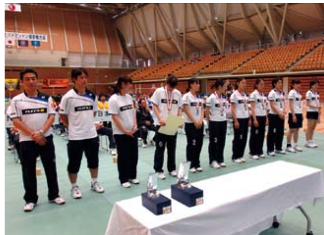
女子二位 NTT東日本 (東京都)