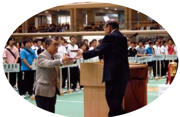
開催地への感謝状