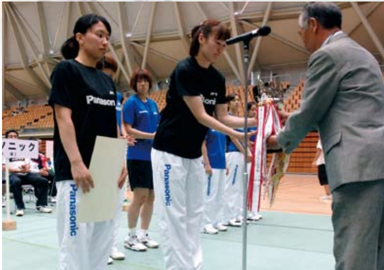
女子優勝 パナソニック (大阪府)