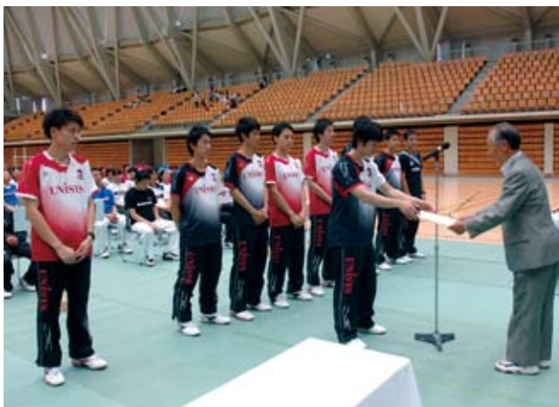
男子二位 日本ユニシス(東京都)