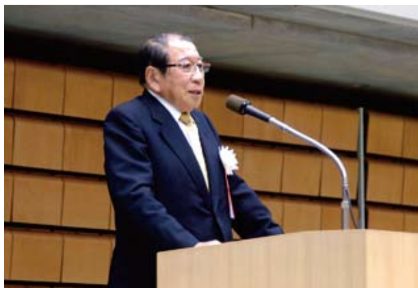
開会挨拶 綿貫民輔日本バドミントン協会会長