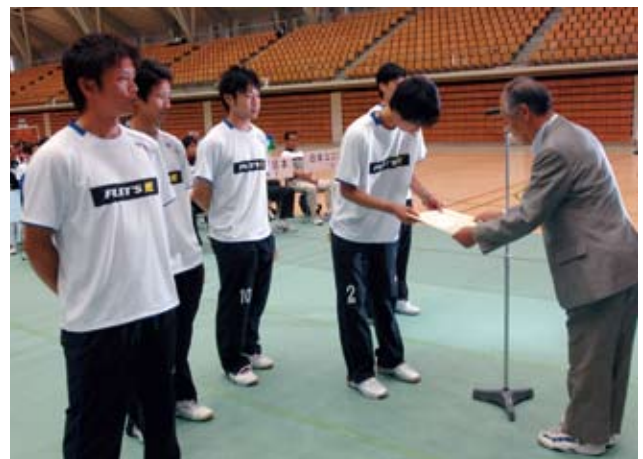
男子三位 NTT東日本(東京都)