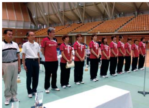
女子三位 広島ガス (広島県)