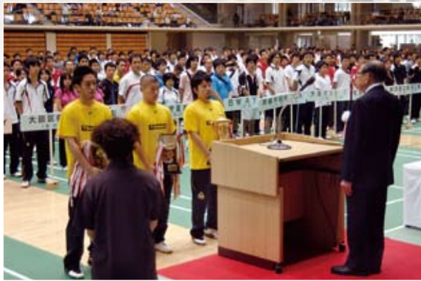
男子優勝杯返還 トナミ運輸(富山県)