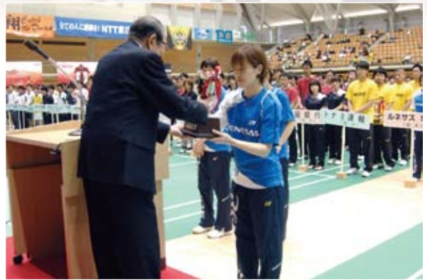
女子優勝杯返還 ルネサス SKY(熊本県)