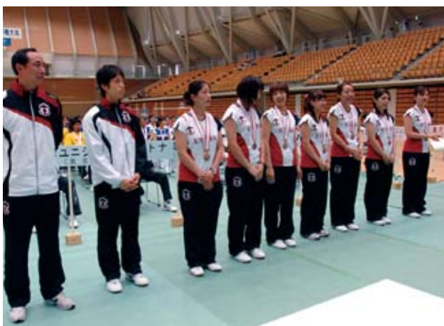
女子三位 日本ユニシス (東京都)