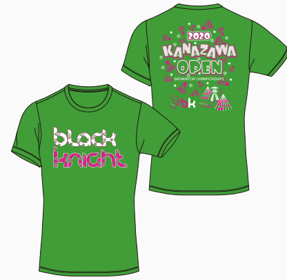
【ブライトグリーン】